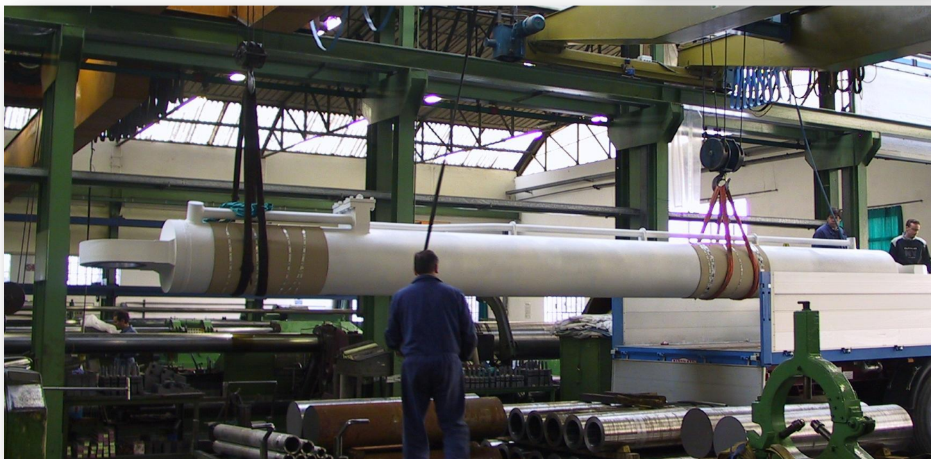
Collaudo, imballo e spedizione