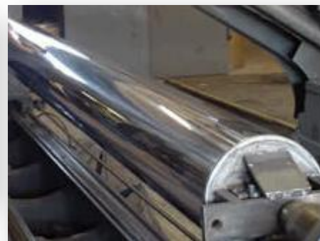
Lavorazioni, ricostruzioni e sostituzioni necessarie